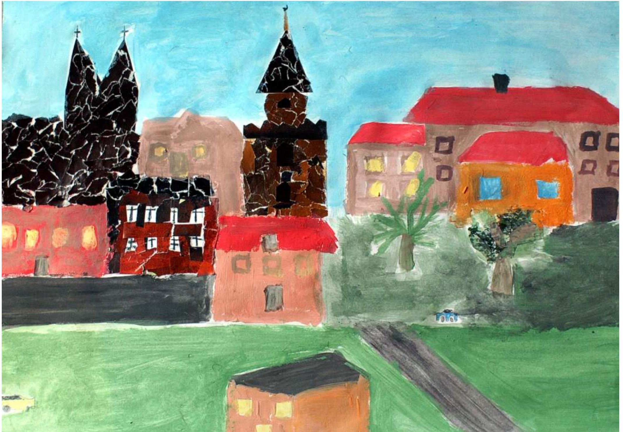
Dom Kata, ul. Grotgera - XVIII w.