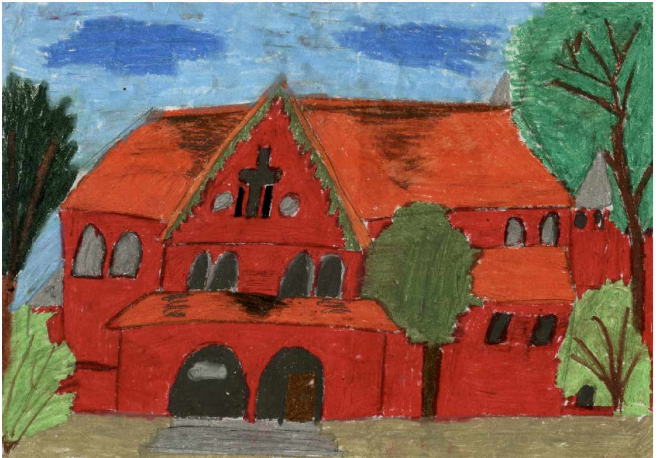
Kościół p.w. Niepokalanego Poczęcia NMP - pocz. XX w.