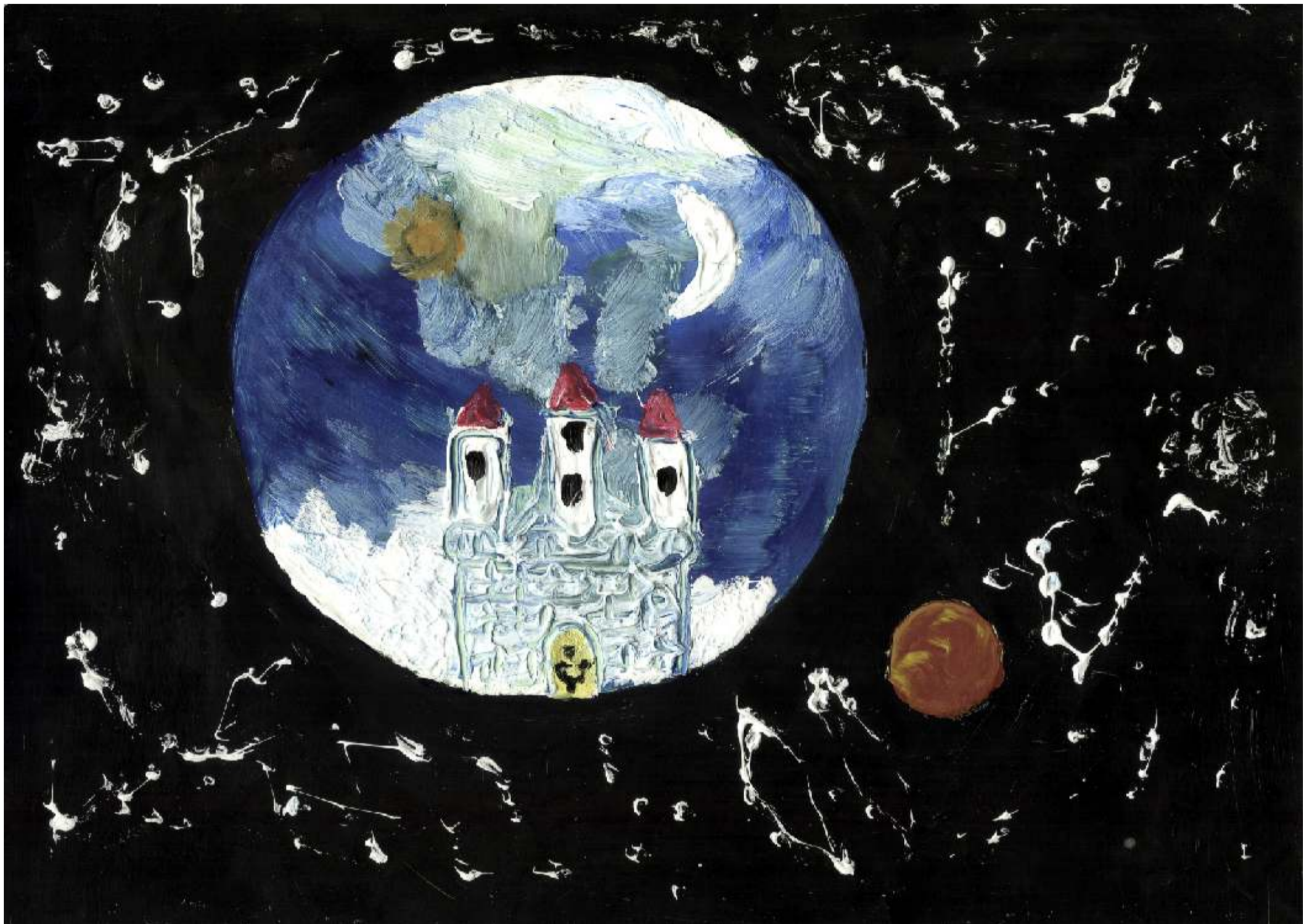
"Chojnow - moje miejsce na Ziemi"