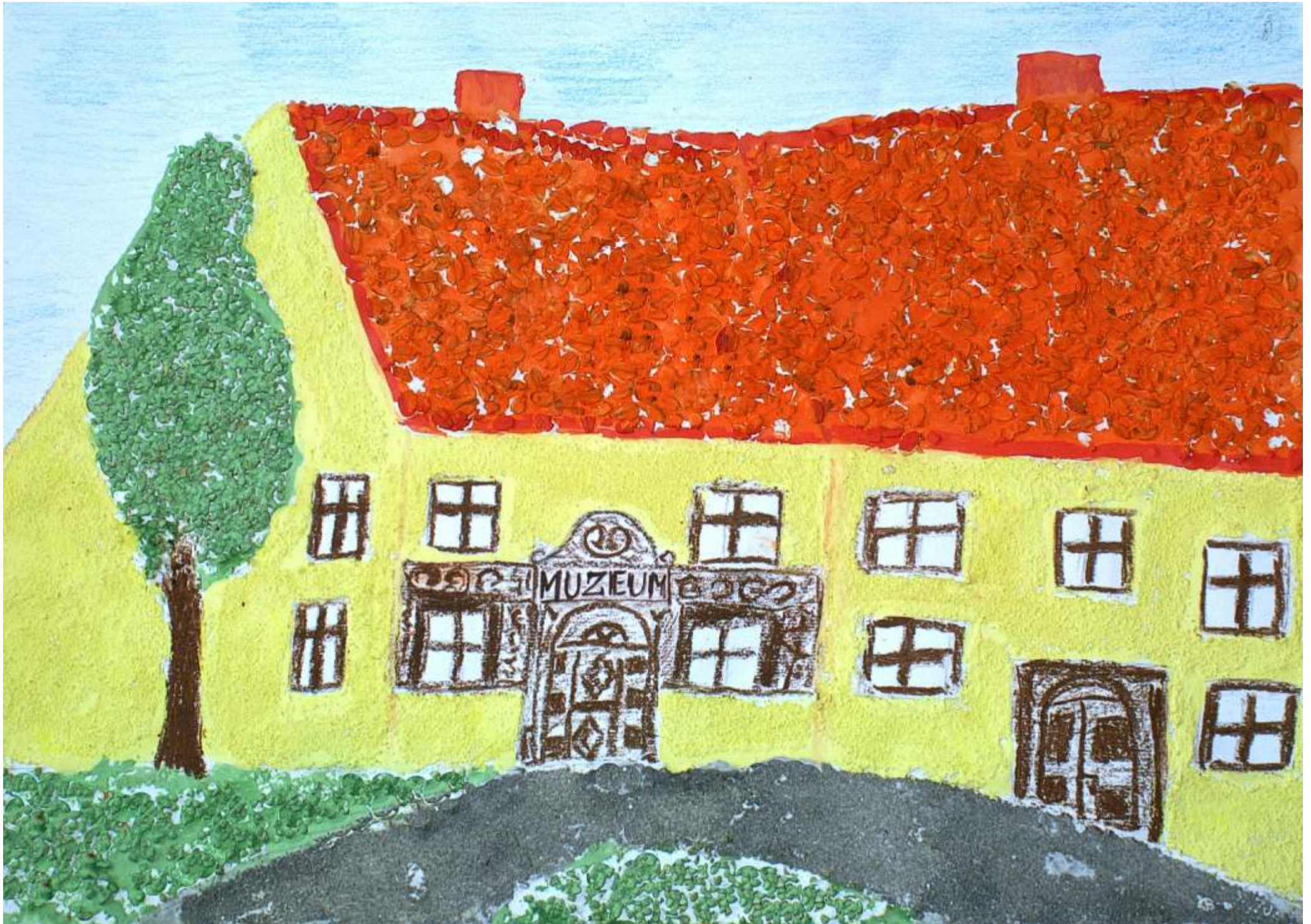
Zamek Piastów - XIV w.