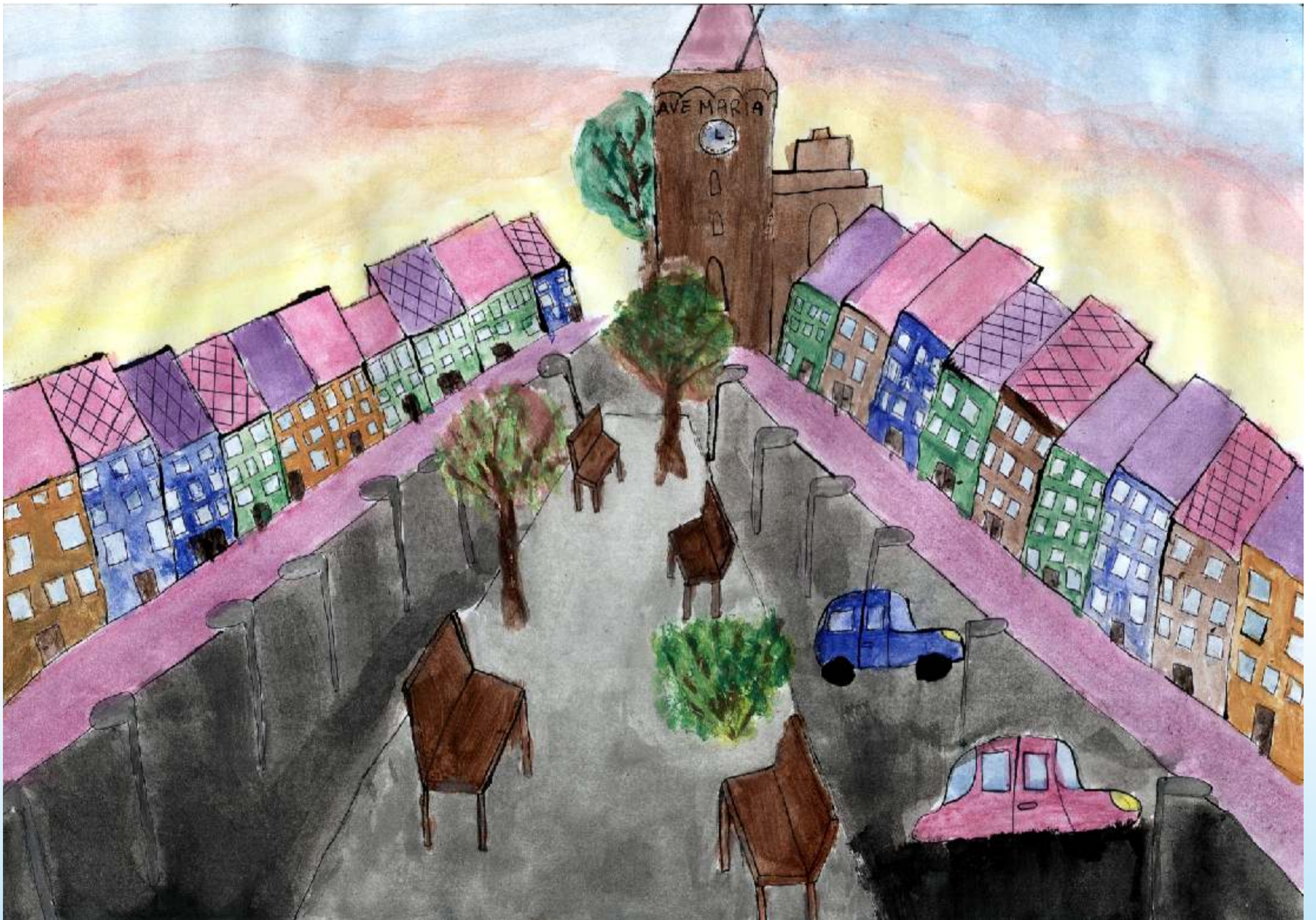
Rynek - XVIII-XX w.