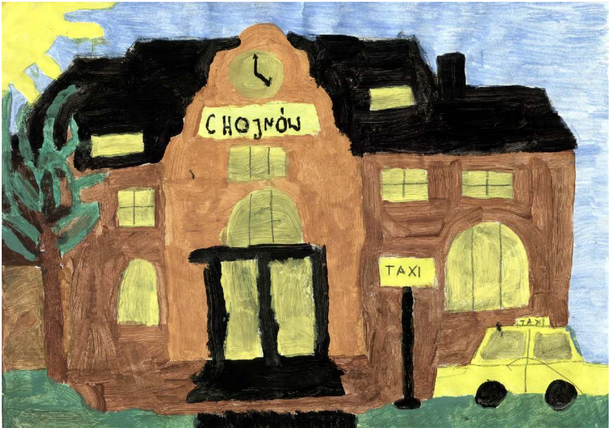
Dworzec PKP - pocz. XX w.